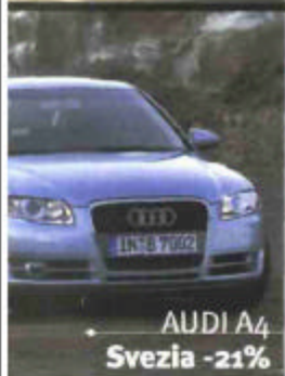
AUDI A4 Svezia -21%