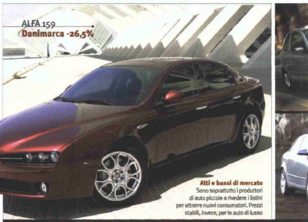
Alti e bassi di mercato Sono soprattutto i produttori di auto piccole a rivedere i listini per attrarre nuovi consumatori. Prezzi stabili, invece, per le auto di lusso

Oltre a Finlandia e Danimarca, dove la maggiore con-