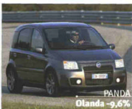
PANDA Olanda -9,6%