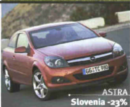
ASTRA Slovenia -23%

quirenti con reddito elevato. I prezzi (Iva e tasse di immatricolazione incluse), tra maggio 2005 e maggio 2006, sono rimasti sostanzialmente stabili, con un aumento dello 0,8 per