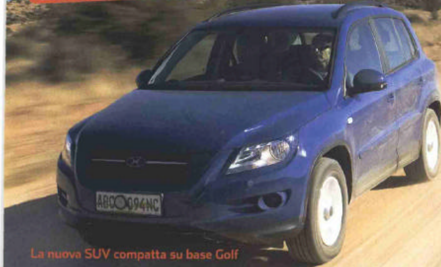
La nuova SUV compatta su base Golf