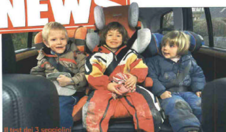
Il test dei 3 seggiolini