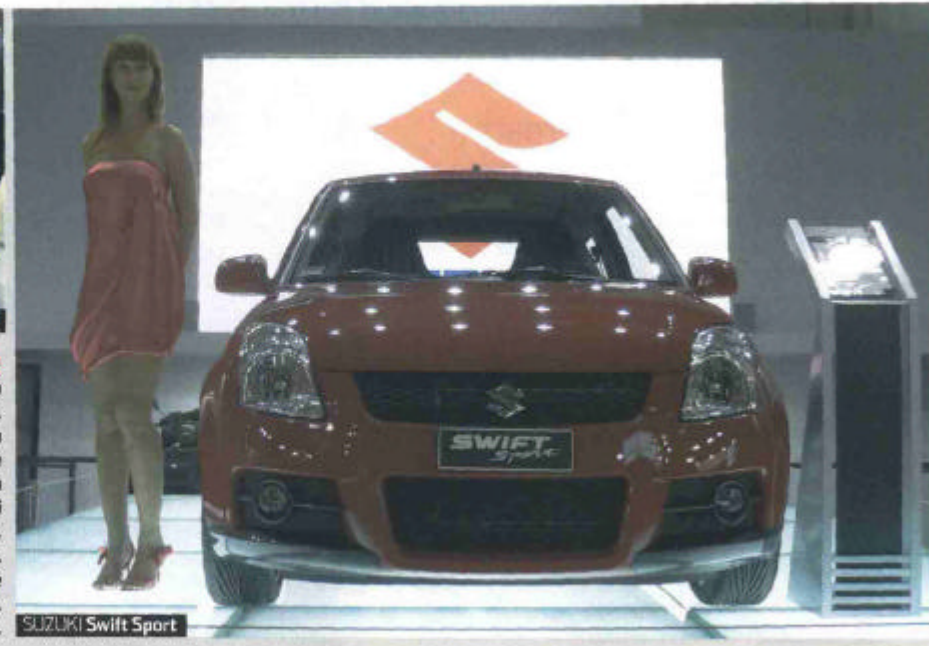
SUZUKI Swift Sport

In entrambi i casi, non stiamo parlando di novità assolute, ma di semplici restyling di carrozzeria. La Suzuki ha esposto in anteprima assoluta il restyling della Swift, che riceve una serie di ritocchi soprattutto al frontale. La Sport (nella foto a destra), in più, ha il fascino paracolpi ridisegnato e dotato di prese d'aria maggiorate, che rendono l'aspetto decisamente più aggressivo. La Tata Indica, invece, si è arricchita di cromature che la fanno apparire un po' meno cheap. Anche questa è una novità della primavera 2007.