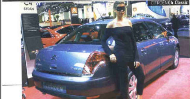
CITROEN C4 Classic

In attesa della Golf VI, ecco nuovi allestimenti per l'attuale. Qui sotto, la GT Sport, che riunisce tutte le versioni più brillanti tranne la GTI. A sinistra, la iGolf, versione giovane dotata di connessione per iPod e iPod nano da 8 Gb. È previsto per le 1.6 da 102 CV, TSI da 140 CV e TDI da 90 e 105 CV.