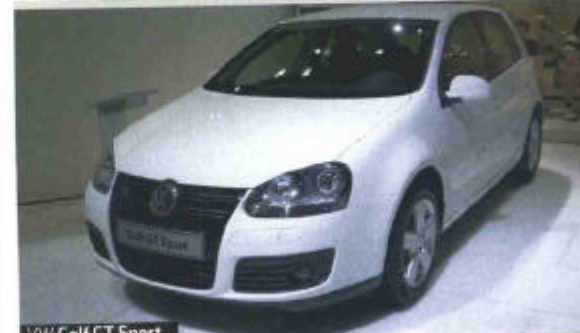
VW Golf GT Sport