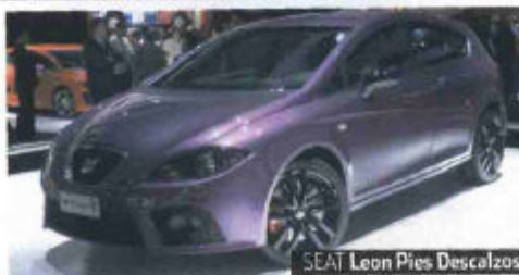
SEAT Leon Pies Descalzos